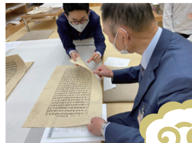
修理監督のようす

令和3年度(2021) からは第2期として 新たに 149点を選出し 、5月に 搬出作業を行いました。本年 度は第2期の一年目というこ とで、令和3年(2021)10 月および令和4年(2022)2月 に、 修理方針を協議 し ました。