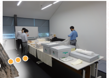
搬出作業のようす

多久頭魂神社が所有する「高麗版一切経」は、 対馬に遺された 貴重な文化財 です。紙の史料としてはと ても古く、虫損や固着、水濡れによる染みなど 損傷が激しい ので、 平成30年(2018)から 大規模な修理計画 が立てられています。 修理には専門的な知識や技術が必要なため、同経典は、 少しずつ九州国立博物館の保存修復室に送られ、 3年で1サイクルとして修理されています。