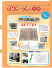
昨年度の修理 成果報告チラシ

令和3年度(2021) からは第2期として 新たに 149点を選出し 、5月に 搬出作業を行いました。本年 度は第2期の一年目というこ とで、令和3年(2021)10 月および令和4年(2022)2月 に、 修理方針を協議 し ました。